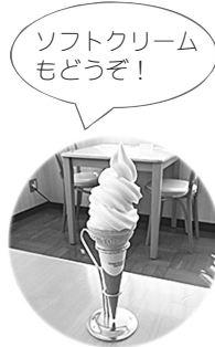
ソフトクリーム もどうぞ!