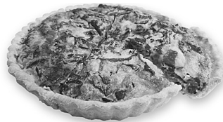
白神まいたけキッシュ 1箱 2,100円