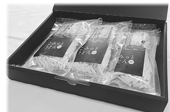
こみっとうどんセット 3袋箱入 1,650円 5袋箱入 2,650円