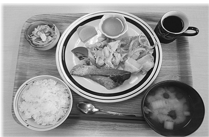
日替わりランチ 800円