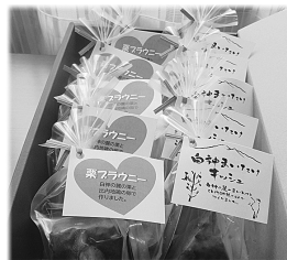
栗ブラウニー ・ミニキッシュセット 各5コ入 3,150円