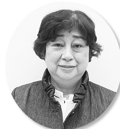
藤里町社会福祉協議会