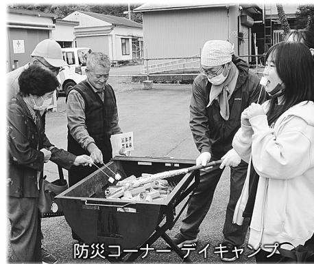
防災コーナー ティーカンパ