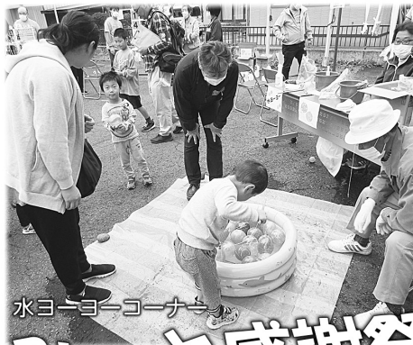
水ヨーヨーコーナー