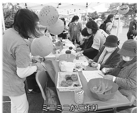
ミニミニかご作り