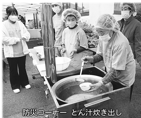
防災コーナー とん汁炊き出し