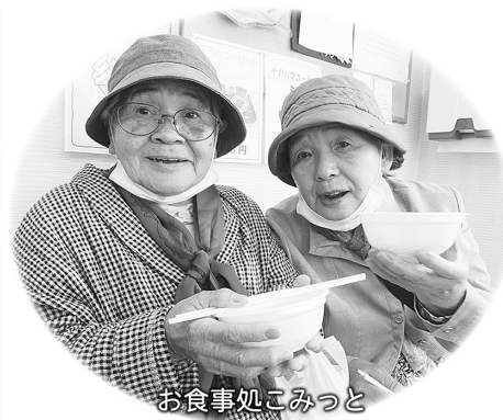
お食事処こみっと