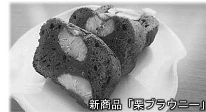
新商品「栗ブラウニー」