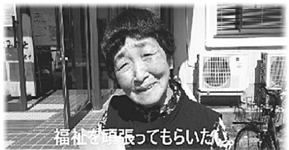
福祉を笑顔で楽しんでいる