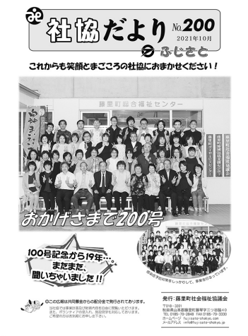
社協だより200号と町民100人動画