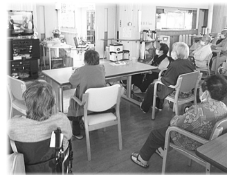
デイサービス、ぶなっち