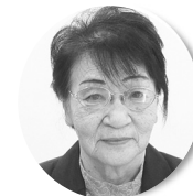
ボランティア団体 すみれの会様