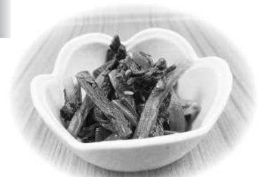
FUJISATO Good Deli