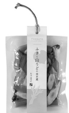
ふきと山うどのふくめ煮 360円