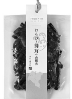
わらびと舞茸の山椒煮 330円