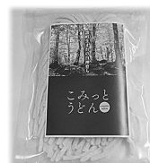
こみっとうどん 500円