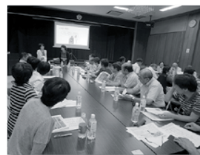
(7月16日 全体会の様子)