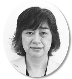
藤里町社会福祉協議会