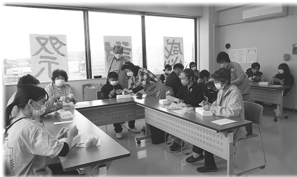
体験型こみっと感謝祭