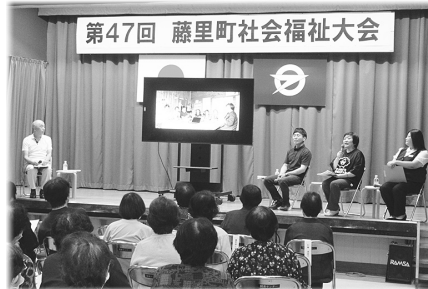
福祉大会通常開催