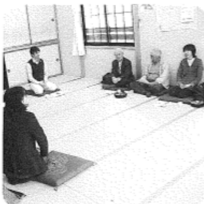
2月18日（水）午前 中通地区 5名参加

Q チャイルドシートの貸出状況が知りたい。 A 平成20年8月から始まった事業ですが、2月末現在で6名のお子さんにご利用して頂いております。