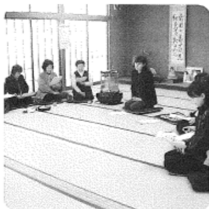
2月18日（水）午後 米田地区 19名参加