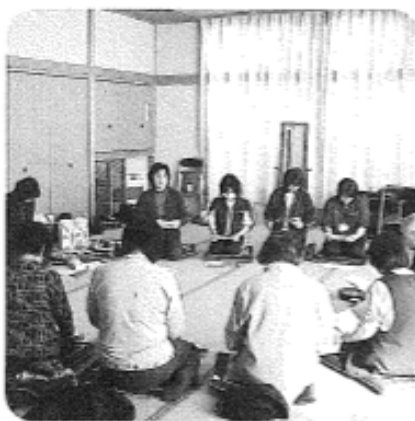
2月17日（火）午後 矢坂地区 8名参加

Q 介護認定を受ける為、病院へ行かなければならないが、医者へ行きたくない人や寝たきりになった人はどうしたらよいのか？ A 往診や移送サービス等の利用法があります。ご相談下さい。