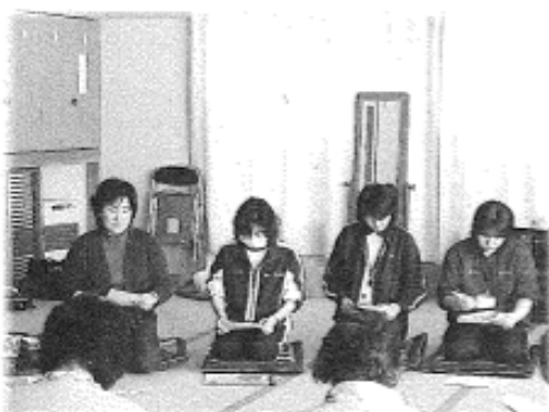
担当者より詳しい説明を致しました