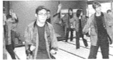
揃いのはんてんでソーラン節 法政大学ボランティアサークルごまちゃん