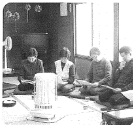
2月24日（火）午前 大沢地区 9名参加