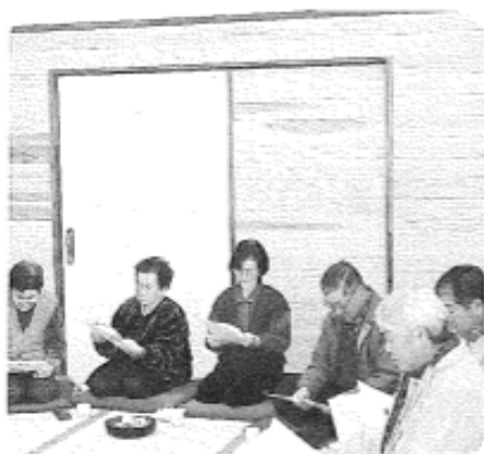
2月19日（木）午後 金沢地区 11名参加