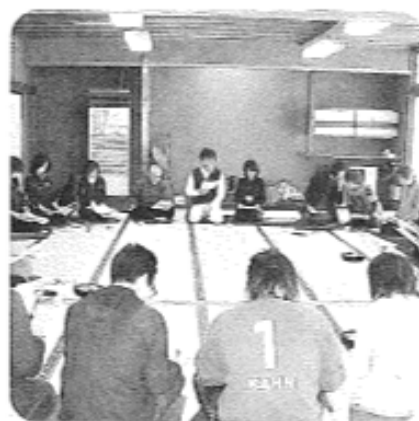
2月17日（火）午前 藤琴地区 20名参加