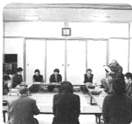
2月19日（木）午前 粕毛地区 11名参加